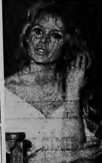
Brigitte Bardot cu tabata tanto den publicidad e ultimo diana aki pa motibo di a hanja maner...

Eerder was in persberichten verklaard dat ten minste één West-Duitse maatschappij een gascentrifuge heeft geconstrueerd voor het zuiveren van splijtbaar uraniumerts. Volgens de „Washington Post” zou een Amerikaans bedrijf al toestemming hebben gekregen om